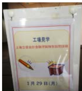
见学当天公全告知