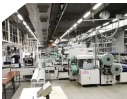
按指定份数包装捆扎

朝日新闻历史悠久，是一家大型综合性媒体，船桥工厂每天需要印刷完成 50 多万分的报纸，但是每天的出勤工作人员只有 20 人，从印刷到分拣打包全是自动化作业，机器发达程度和工作效率令人叹为观止。该工厂的印刷以朝日新闻的朝夕刊为主，同时还兼印其竞争对手読売新聞的刊物，相互竞争相互合作旨在面临紧急情况时能将第一手消息传达给民众；印刷所使用的铝板和四色层叠印刷完成之前的色缺损纸也是可以回收再利用的。进入工厂，各式各样的大型机器组成完整的印刷分拣链，近乎全自动的流水线旁依旧有进行实时点检的工作人员，确认无误后装车发往各个下级中心。朝日新闻为了欢迎我校的到来，特地在朝日新闻 1 月 30 日的早报上留下了我校来访的记录，对此我们感到十分的荣幸。