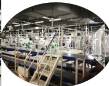
确认无印刷模糊污点