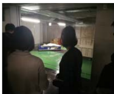
运送 1 吨纸卷使用后轴心的无人机